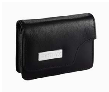
Etui cuir LC-T1 N°50128

Télécommande E avec fonction zooming et déclenchement N° 37376