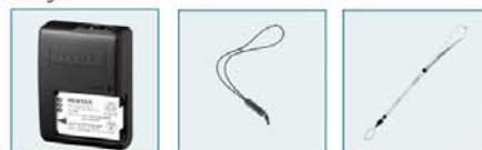
Kit chargeur batterie (livré sans batterie) Dragonne sport Dragonne en cuir