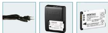
Câble AC Chargeur de batterie Batterie Li-ion