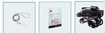
Dragonne métal Jeu de films de protection (Écran LCD 2,5") Kit adaptateur secteur

Pour plus d'informations, consultez le site www.pentax.fr Centre Conseils Consommateurs : 0826 103 163 (0,15€/min)