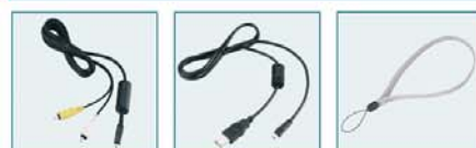
Câble AV Câble USB Dragonne