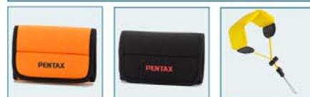
Etui néoprène orange Etui néoprène noir Dragonne flottante