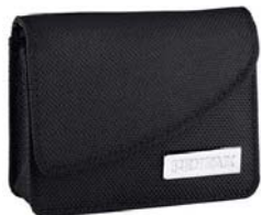
Etui nylon N° 50101