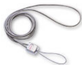
Courroie de cou métal N° 39166