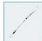
Dragonne en cuir

Pour plus d'informations, consultez le site www.pentax.fr Centre Conseils Consommateurs : 0826 103 163 (0,15€/min)