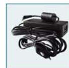
Kit adaptateur secteur