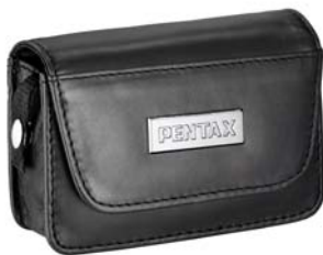
Housse en cuir N° 50085