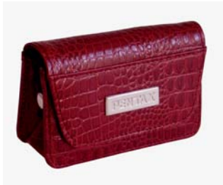
Housse burgundy N° 50092