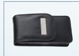
Étui en cuir Optio WPI