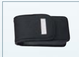
Étui en néoprène Optio WPI

Depuis des dizaines d'années, des innovations techniques de la plus haute qualité.