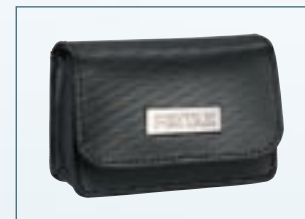
Étui en cuir Optio S5z